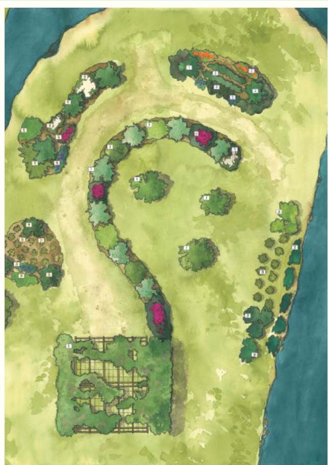
LE JARDIN DU BORD DE L'EAU

Plans des deux aménagements paysagers comestibles au parc du lac Lachance